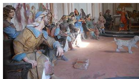
Sacro Monte di Ossuccio

Per la prima settimana di settembre la zona del Centro ed Alto Lago offre concerti, passeggiate e feste danzanti. Giovedì 8 la Festa del Santuario della B. V. del Soccorso, con pellegrinaggio tra le splendide cappelle del Sacro Monte.