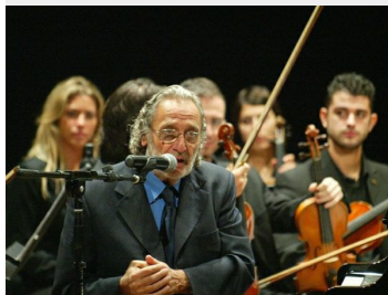
Luis Bacalov, il premio Oscar sarà ospite a Bellagio

BELLAGIO - Bellagio si candida a nuova capitale estiva della musica. Nel nome di Franz Liszt - per il bicentenario dalla nascita del compositore ungherese che scelse la punta del Lario come affascinante rifugio romantico, ma con lo sguardo già rivolto ai due bicentenari verdiano e wagneriano del 2013 e all'Expo 2015 - dalla rassegna LISZTmania degli scorsi anni nasce il Festival di Bellagio e del Lago di Como .